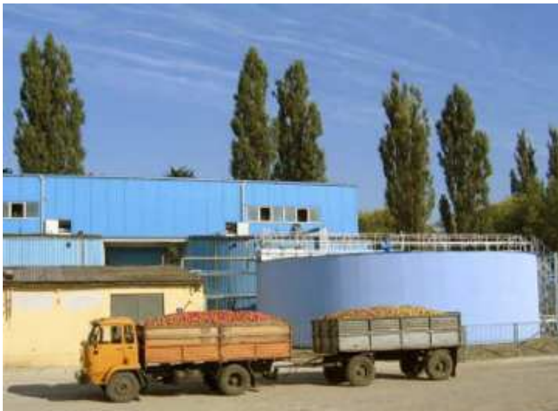
Външен изглед на фабриката