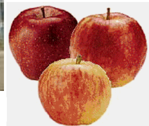
Outside view of the plant